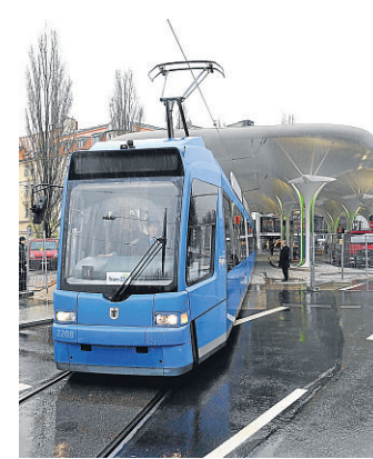
Die neue Tram 23 stellt nicht alle Fahrgäste zufrieden.

Freiheit ist ebenfalls eine Zumutung. Die Radfahrer drängen direkt neben der Wartzone, als Sitzgelegenheit dienen kleine Puppenstühle ohne Lehne, die nicht annähernd den Sitzbedarf decken. Denkt man in München auch einmal an ältere Herrschaften?