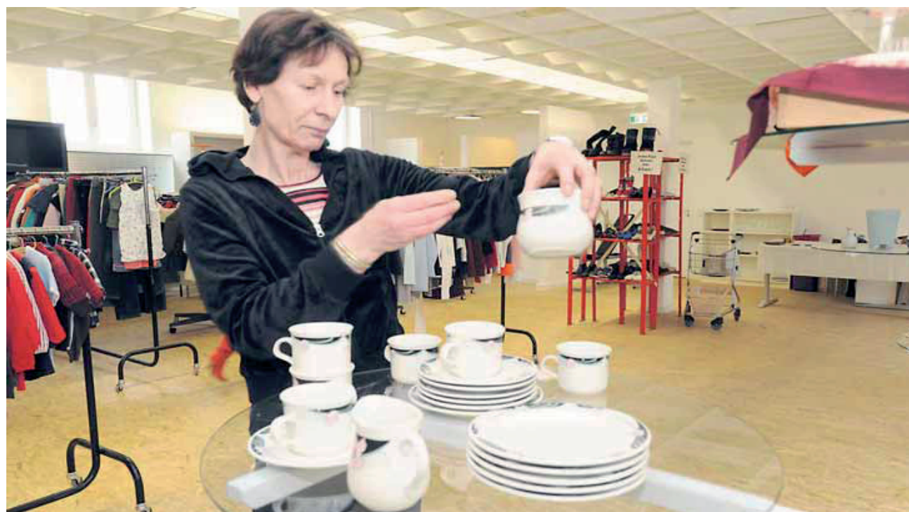
In Gebrauchtwarenhäusern, wie dem des Weißen Raben in München, finden finanziell schlechter Gestellte alles, was man für die Wohnung und den Alltag braucht zu günstigen Preisen.

Es gelten die Allgemeinen Geschäftsbedingungen der Inserenten. Die Konditionen sind Richtwerte der Banken. Alle Angaben ohne Gewähr. Die Veröffentlichung erfolgt im Auftrag der obengenannten Kreditinstitute.